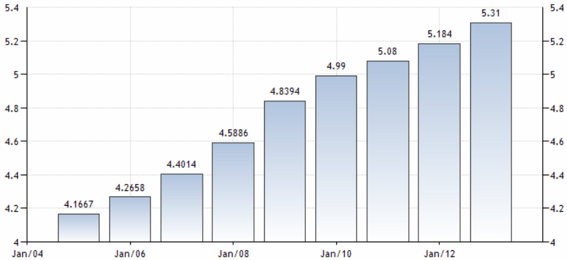
Tablo: 2004- 2013 Nüfus Artış Grafiği 1

2012 yılı ve 2013 yılı nüfus artış oranları ise %0,1 düzeyinde gerçekleşmiştir. Devletin Singapur vatandaşları arasında nüfusu artırabilmek amacıyla çeşitli teşvikler sağlamasına karşın, nüfus artış oranı düşük seviyelerde seyretmektedir.