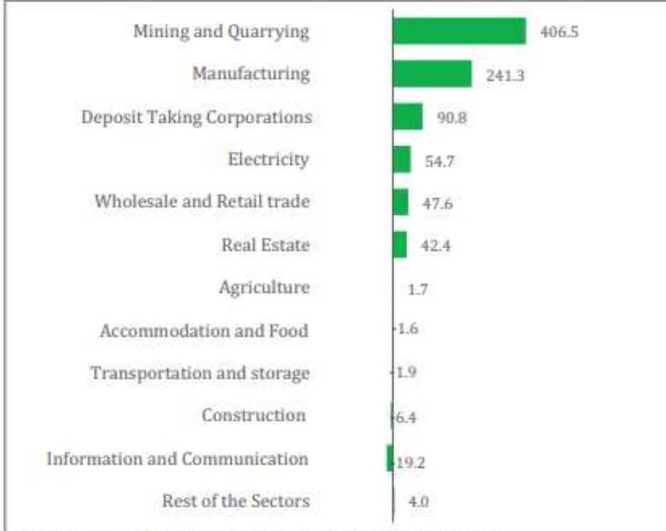
Foreign Direct Investment Liability Inflows by Sector (US$ million), 2020