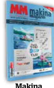
Makina Magazin Türkiye