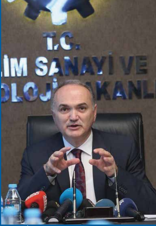
İlk kez avans imkanı da getirildi