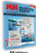
Makina Magazin Türkiye

Dünya Süper Veb Ofset A.Ş. Maslak Bölge Temsilciliği Tel: (0212) 278 13 48 - (0212) 281 42 54 Gsm: (530) 661 80 22 maslak@dunya.com