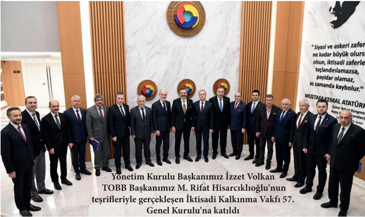
Yönetim Kurulu Başkanımız İzzet Volkan TOBB Başkanımız M. Rifat Hisarcıklıoğlu'nun teşrifleriyle gerçekleşen İktisadi Kalkınma Vakfı 57. Genel Kurulu'na katıldı

İktisadi Kalkınma Vakfı (İKV) 57. Genel Kurulu'nda konuşan TOBB Başkanı Hisarcıklıoğlu, İktisadi Kalkınma Vakfı'nın, iş dünyasının Avrupa Birliği'ne açılan penceresi olduğunu belirterek, "İKV'nin tarihi, esasen Türkiye'nin Avrupa Birliği ilişkileri tarihiyle paraleldir. İKV, Türkiye'nin Avrupa Birliği ilişkilerine, iş dünyasının somut bir desteğidir. İKV'yi kurma vizyonunu gösteren, iş dünyamızın duayenlerini, bu vesileyle rahmetle ve saygıyla anıyorum. Onlar, Türkiye'nin geleceğine kalıcı bir yatırım yaptılar. İş dünyasına, gelecek nesillere taşımamız gereken çok önemli bir miras bıraktılar" dedi.