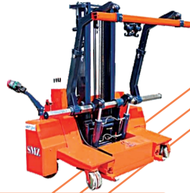
SMZ LEVENT YERLEŞTİRME İSTİFİ