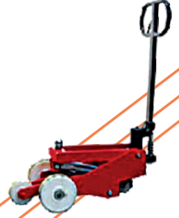
SMZ MANUEL DOK ÇEKER