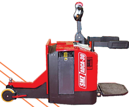
SMZ DOK ÇEKME TRANSPALETİ