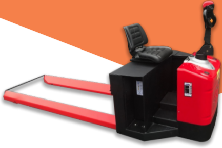
SMZ LEVENT TAŞIMA TRANSPALETİ