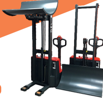
SMZ RULO TOP KUMAŞ İSTİFİ