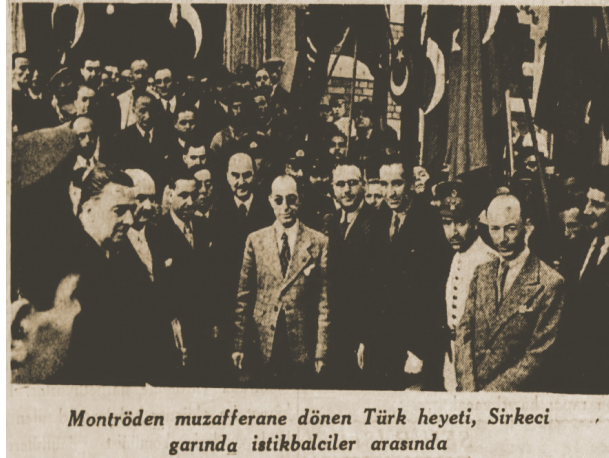
Montröden muvaffakane dönen Türk heyeti, Sirkeci garında istikbalciler arasında