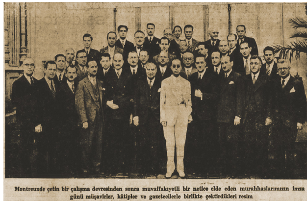
Montreuzde çetin bir çalışma dersinden sonra muvaffakiyetli bir netice elde eden murahhaslarımızın İsmail günlü mübaharlar, kâtipler ve gazetecileri birlikte çıktıkları resim

Montrö, imzalandığı 20 Temmuz 1936'da Türkiye'nin her yerinde sevinç gösterileri ile karşılandı. Boğazlar,