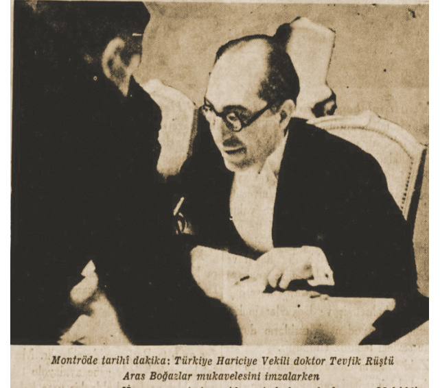
Montröde tarihi dakika: Türkiye Hariciye Vekili doktor Tevfik Rüşdü Aras Boğazlar mukavelesini imzalarken

20 Temmuz 1936'da imzalanan, Montrö'nün en bağlayıcı maddeleri 'savaş zamanları' konusu oldu. Montrö yürürlüğe girdikten kısa bir süre sonra da Türk Boğazları'nın stratejik öneminin tekrar gündeme geldiği II. Dünya Savaşı başladı. Türkiye, II. Dünya Savaşı başlayana